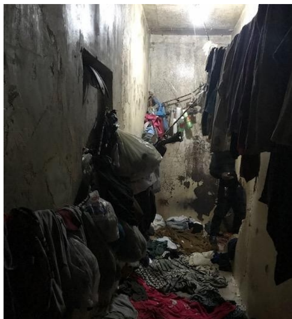
FIGURA 2 - Interior da carceragem da Delegacia Regional de São José dos Pinhais.

FIGURA 3 – Interior da carceragem da Delegacia Regional de São José dos Pinhais (varal improvisado com outras e outros utensílios).