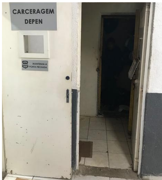
FIGURA 1 – Entrada da carceragem da Delegacia Regional de São José dos Pinhais.