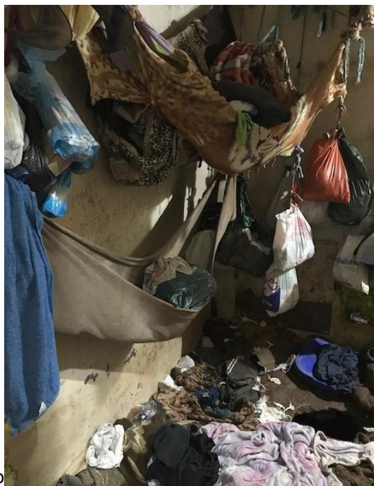
FIGURA 5 – Interior da carceragem da Delegacia Regional de São José dos Pinhais (chuveiro).