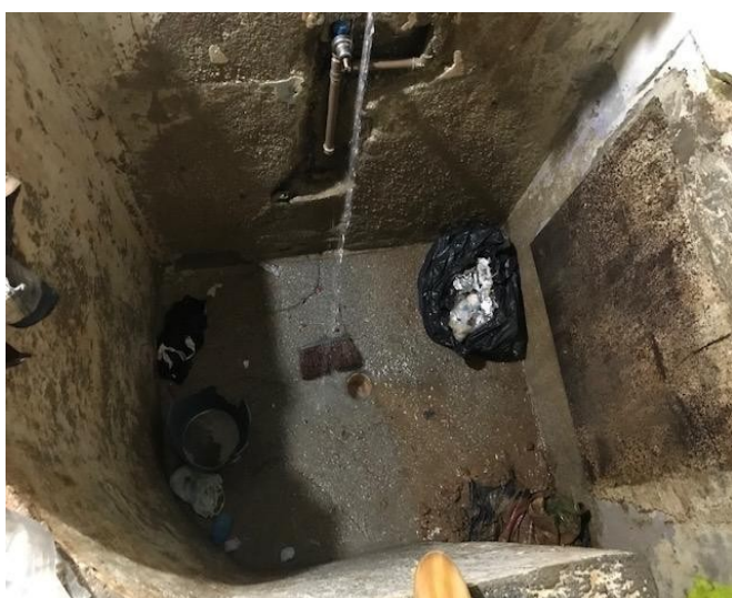
FIGURA 6 – Interior da carceragem da Delegacia Regional de São José dos Pinhais (chuveiro).